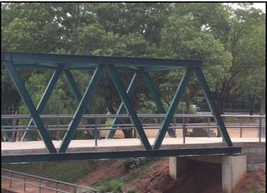
Detalhe: Passarela Metálica