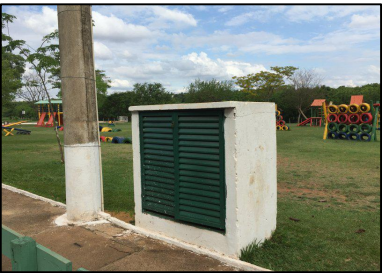
Detalhe: Painel existente Ecoparque